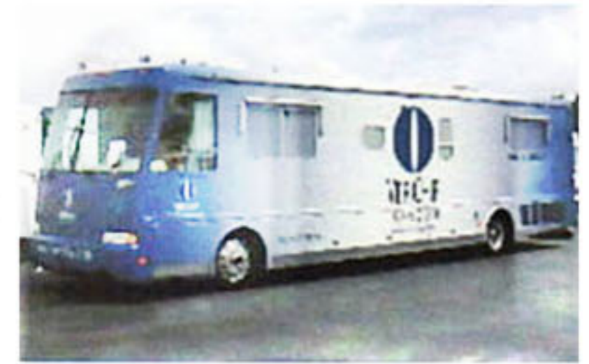
(替人植入晶片的Verichip 流動巴士。)